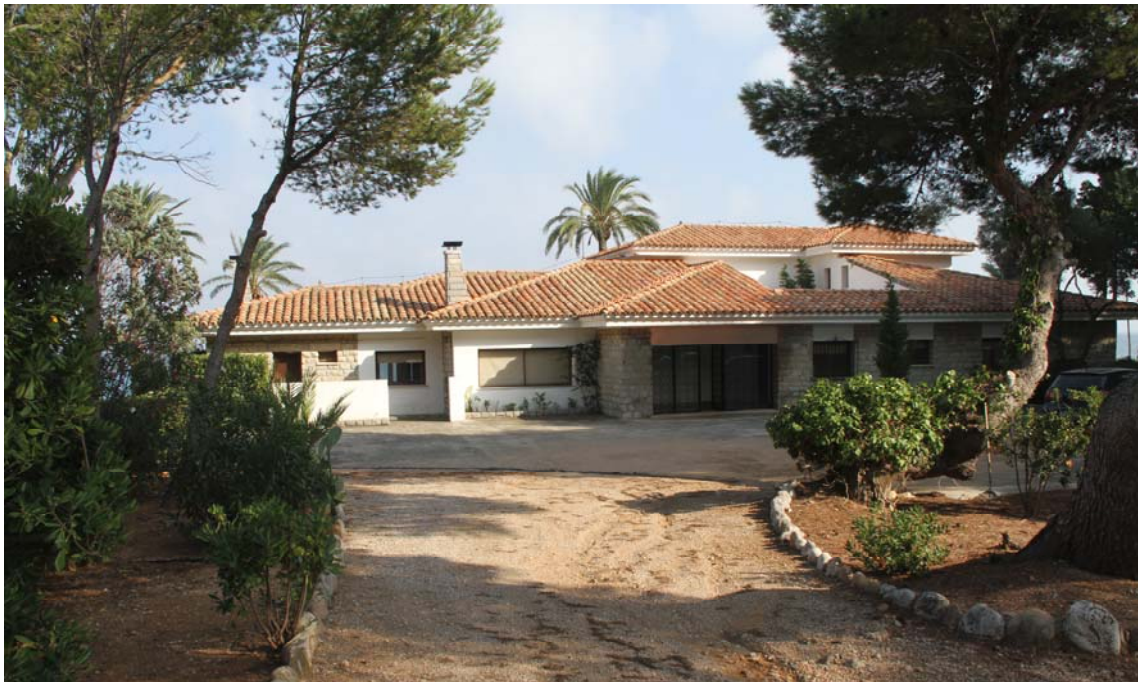
Estado reformado Vivienda unifamiliar aislada (La reforma consiste en demolición de la losa puerta de acceso).