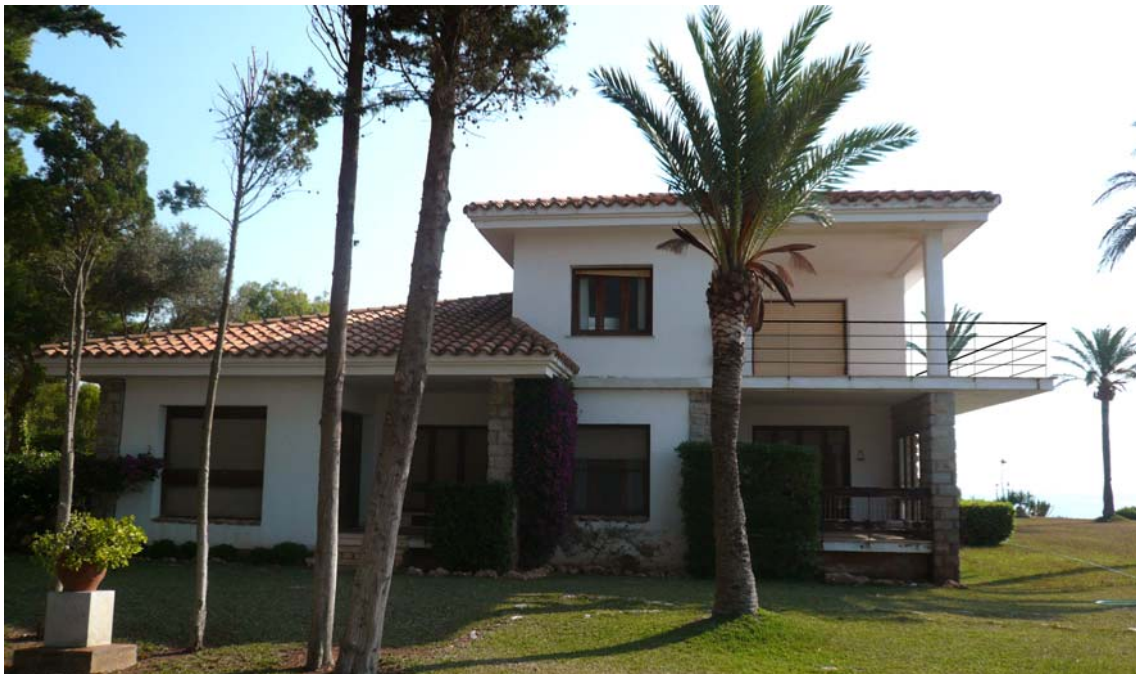
Estado reformado Vivienda unifamiliar aislada (La reforma consiste en sustitución barandilla)