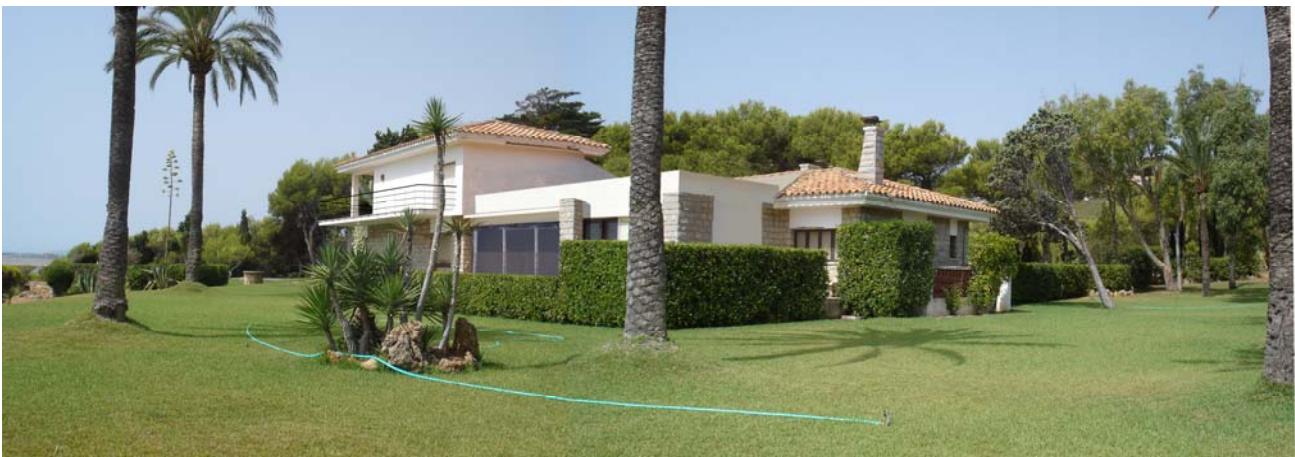
Estado reformado Vivienda unifamiliar aislada (La reforma consiste en demolición de parte del cerramiento y cubierta y sustitución de barandilla).