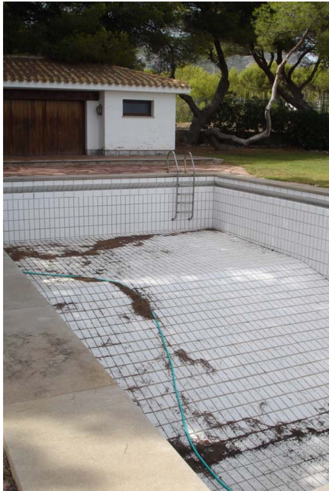
Piscina se sana el alicatado