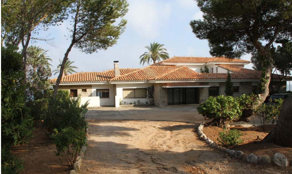
Estado actual Vivienda unifamiliar aislada.