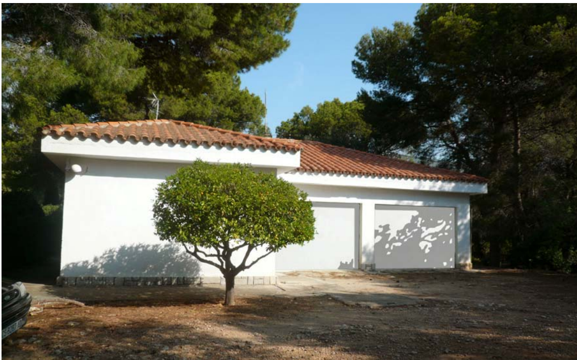
Estado reformado Casa Guarda-garaje (La reforma consiste en Pintar la fachada y puertas).