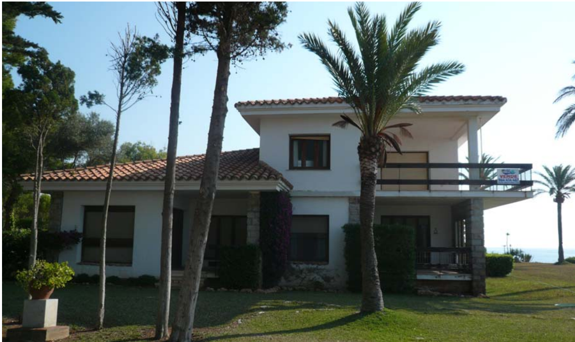
Estado actual Vivienda unifamiliar aislada