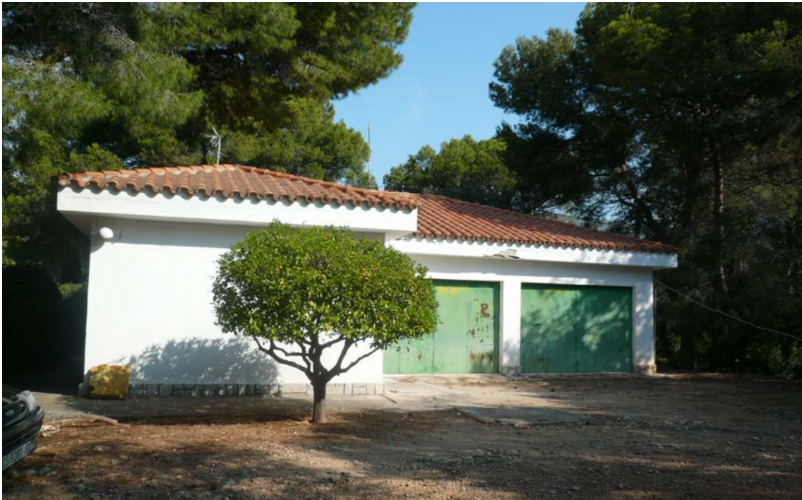
Estado actual Casa Guarda-Garaje.