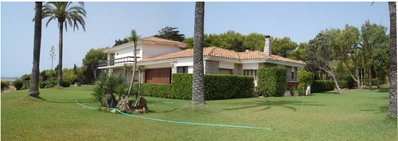
Estado actual Vivienda unifamiliar aislada.